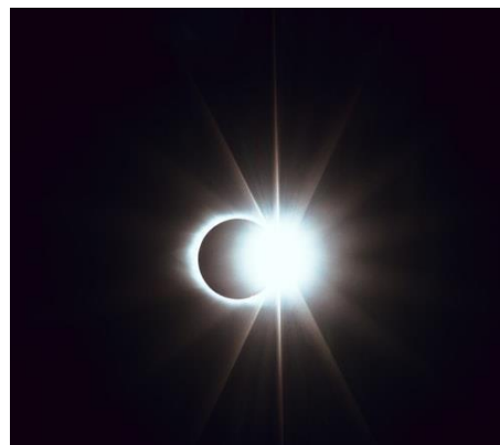
1 Zonsverduistering

Jezus is koning! En Jezus' doornenkroon schijnt zo helder vanaf zijn troon van het kruis, dat het de duisternis verblindt. Hij nam de duisternis van onze zonde en ziekte, ons lijden en de dood – de duisternis van de hel – op zich, om het kwaad te overwinnen en de schepping te verlossen uit de greep van het kwaad.